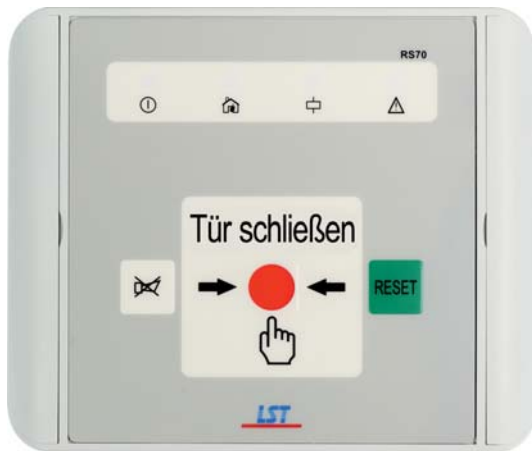
RS70-1 řídící jednotka