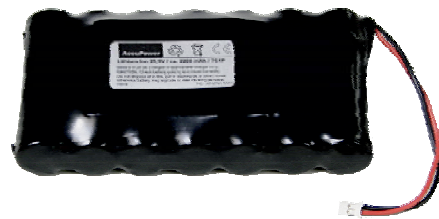
akumulátor pro RS70-1